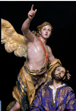
Oración del Huerto